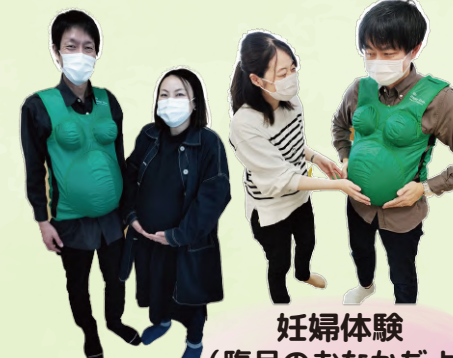
妊婦体験 (臨月のおなかだよ)